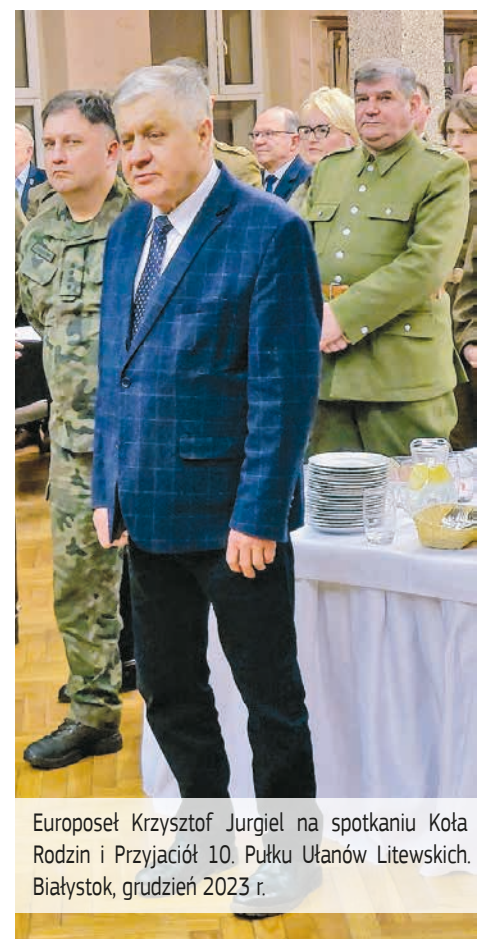
Europeoseł Krzysztof Jurgiel na spotkaniu Koła Rodzin i Przyjaciół 10. Pułku Ułanów Litewskich. Białystok, grudzień 2023 r.

Swego czasu jako minister rolnictwa wyszedłem z pomysłem, by